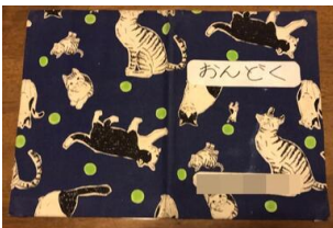
音読カードカバー