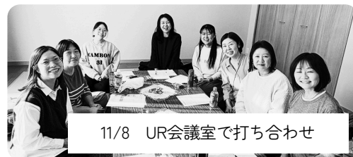
11/8 UR会議室で打ち合わせ

日ごろは卒業準備へのご協力、本当にありがとうございます。アルバム購入や制服採寸など、アンケート続きでご負担をおかけしてしまい、もうしわけありませんでした。（でもまだ続きます...ごめんなさい）卒業準備も本格的に動き始め、卒業記念品も決まりました。どんな記念品になるかは...当日までのお楽しみにしてくださいね。